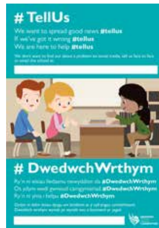
Poster ymgyrch #DwedchWrthonNi

Anogir disgyblion i ddweud wrth eu rhieni, gofawyr neu athrawon os cânt eu bwlio. Mae cyngor ar gael ar wefan y cyngor, ewch i www.newport.gov.uk/en/Schools-Education/Bullying.aspx